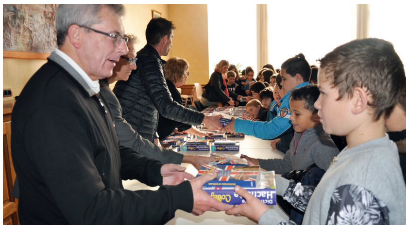
La Caisse des écoles, présidée par Monsieur le Maire, a remis un dictionnaire à chaque élève de CM2 le 10 novembre dernier