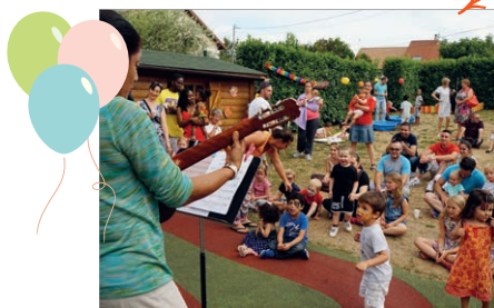
La fête du Relais des Assistantes Maternelles