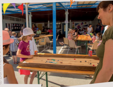
École Amboise Paré