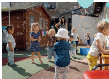
La fête de la crèche