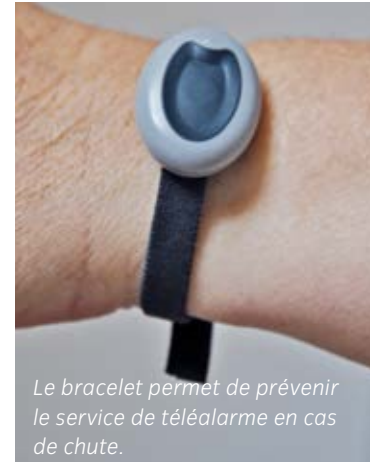
Le bracelet permet de prévenir le service de téléalarme en cas de chute.

Les personnes âgées, dépendantes et/ou en situation de handicap peuvent bénéficier de la téléalarme pour continuer à vivre chez elles en toute sécurité, 24 heures sur 24. Pour les personnes non impossibles, les frais de location sont pris en charge par le Centre Communal d'Action Sociale. Contacter le CCAS pour effectuer une demande (un avis d'imposition sera exigé).