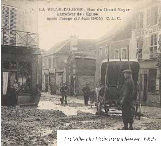
La Ville du Bois inondée en 1905

Le 19 juin dernier a eu lieu un épisode pluvieux exceptionnel, qui a provoqué des inondations et coulées de boues à divers endroits de la ville. La partie Nord avec le centre commercial et la RN20 a été la plus touchée avec une inondation des parkings et des 4 voies de circulation. Au sud, le Mort Rû, en sortant de son lit, a provoqué des coulées de boues sur la chaussée et a inondé des sous-sols d'habitations.