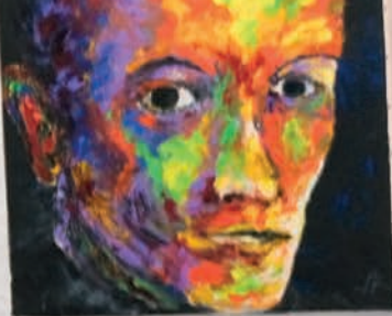
Œuvre n°103 "Les gens" Exposé Après 20/10/2018