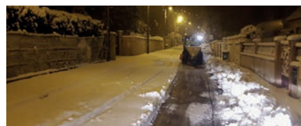
3h30 passage de la lame de déneigement

Une seconde équipe a pris le relais le mercredi matin afin de traiter les voies tertiaires en impasse et certaines rues très pentues où il est difficile d'accéder avec les véhicules de déblaiement.