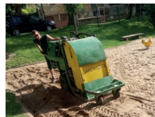
Le sable de l'aire de jeux place Beaulieu est régulièrement nettoyé.

L'entretien des voies publiques est nécessaire pour maintenir la commune dans un état constant de propreté et d'hygiène. Les mesures prises par la collectivité ne peuvent donner de résultats satisfaisants qu'avec le civisme et le concours des habitants, auxquels des obligations sont imposées dans l'intérêt de tous. La Ville a décidé de réglementer l'entretien des voies publiques à travers un arrêté.