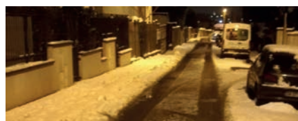
6h45 la voie des Postes est dégagée

La propreté de la ville est l'affaire de tous, c'est pourquoi nous sollicitons votre participation à l'effort collectif