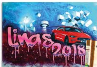
Flash à Linas