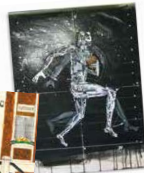
Rugbyman in motion

Réalisation de Maxence Piedeloup, jeune Urbisylvain