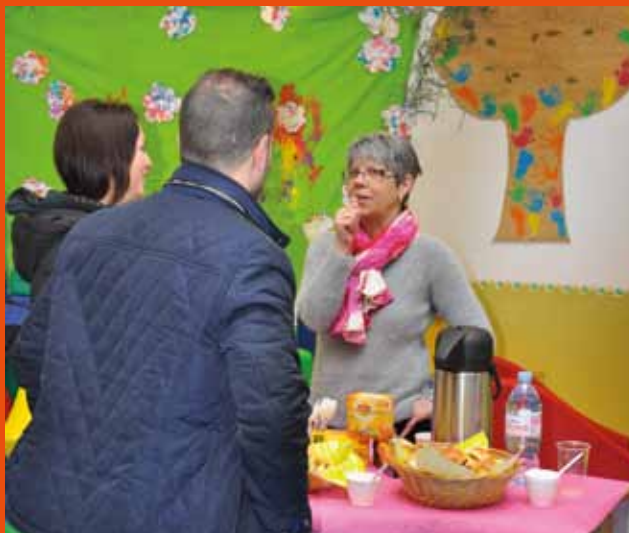
Multi-accueil - 11 chemin des Berges - 01 69 80 63 41