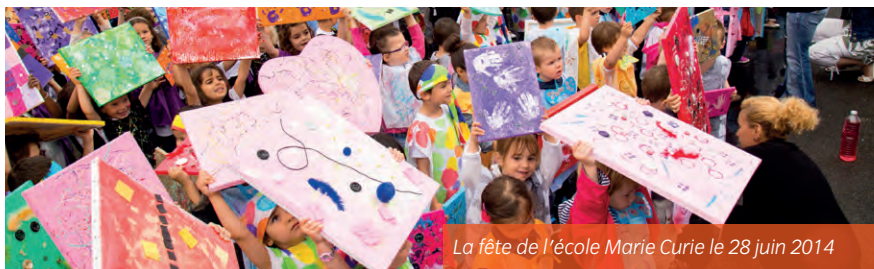
La fête de l'école Marie Curie le 28 juin 2014

La caisse des écoles intervient en faveur des enfants relevant de l'enseignement du premier et du second degré, dans les domaines sociaux et culturels de la vie scolaire.