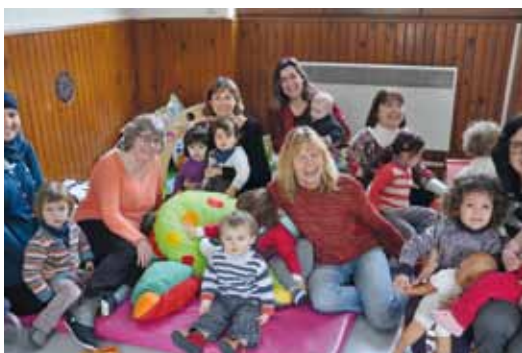
Réfléchir ensemble pour proposer une animation qui sorte de l'ordinaire, c'est ce qui motive les assistantes maternelles

Il était une fois la bibliothèque qui propose aux enfants le kamishibai, sorte de petit théâtre-lecture. Les assistantes maternelles, dans le cadre du Relais Assistantes Maternelles, décident alors d'utiliser cette idée lors du carnaval des petites bêtes, en 2012, puis de la journée de la petite enfance, en mai 2013.