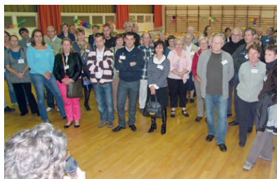
La soirée des associations, en septembre 2012 : l'occasion d'échanger

Les associations de la ville organisent ponctuellement des animations ouvertes à tous et sont très actives lors des manifestations organisées par la municipalité : fête des associations bien entendu, Téléthon, fête du sport, fête du patrimoine... Chaque année, le Maire les invite à une soirée afin de les remercier de leur engagement. L'occasion de se rencontrer, d'échanger autour des projets.