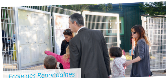
Ecole des Renondaines

Calmes et sereins : c'est ainsi que l'on peut qualifier le jour de la rentrée, alors que tous les enseignants et les trois directrices étaient en poste. Les 709 élèves des écoles publiques de la ville ont repris le chemin de l'école dans de bonnes conditions.