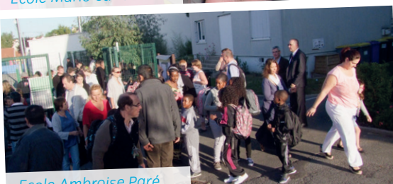
Ecole Ambroise Paré