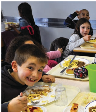
Dernier jour de la "semaine du goût" en octobre : au travers de leur assiette, les enfants découvrent l'Alsace

Dans le cadre du marché de la restauration avec SFRS/Sodexo, la ville a été particulièrement vigilante sur quelques points, pour offrir une qualité de repas optimum aux enfants.