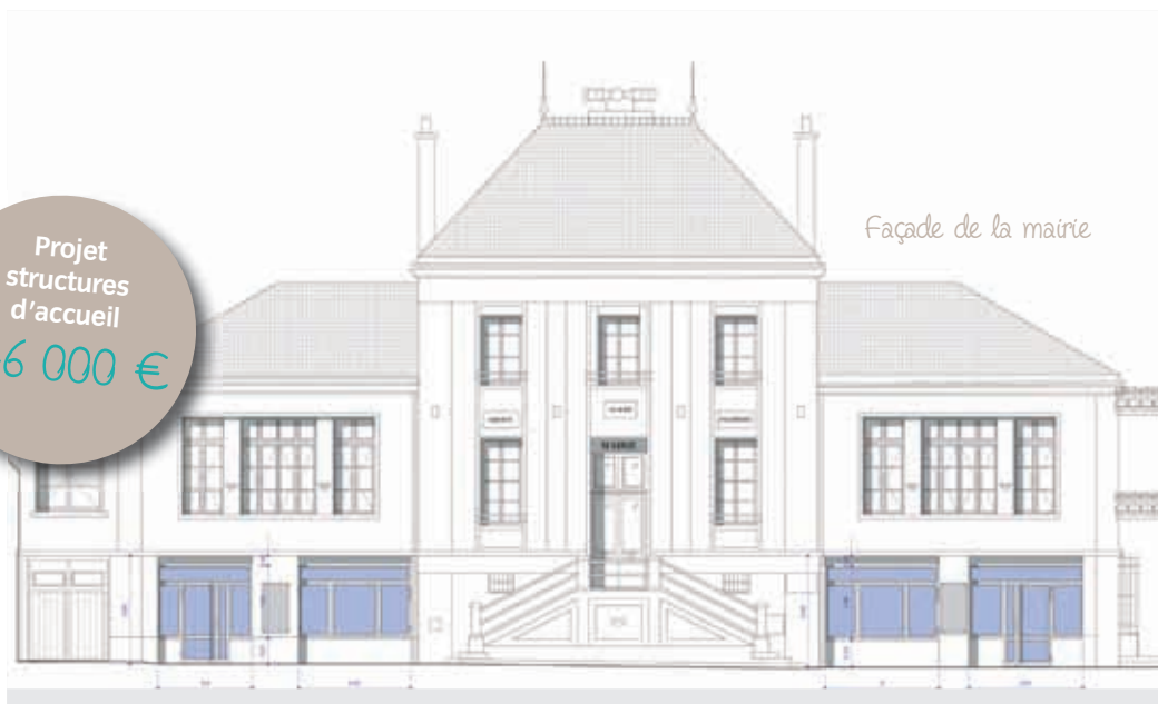
Façade de la mairie