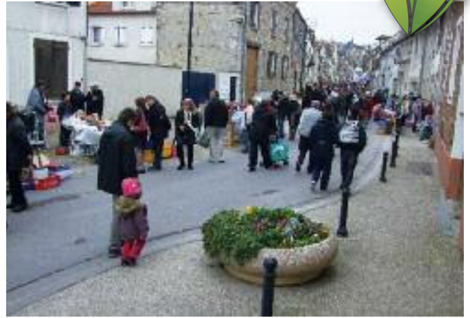
La brocante organisée en mars par le Syndicat d'Initiative rassemble brocanteurs et badauds.