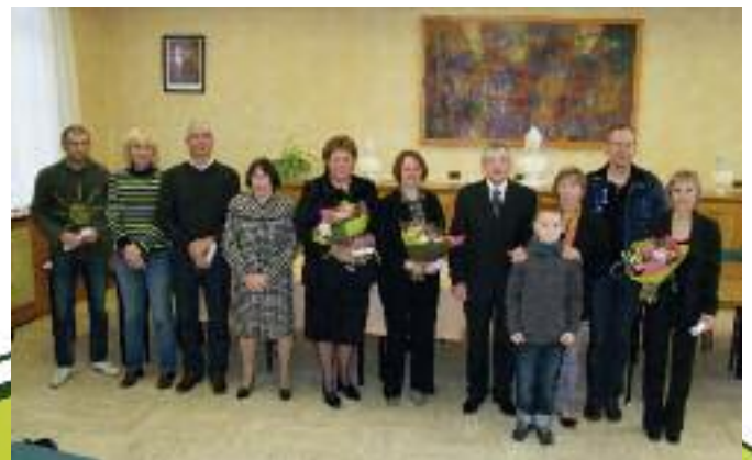
Le 26 février, autour du Maire et des élus, quelques médaillés se prêtent au jeu de la photo souvenir.