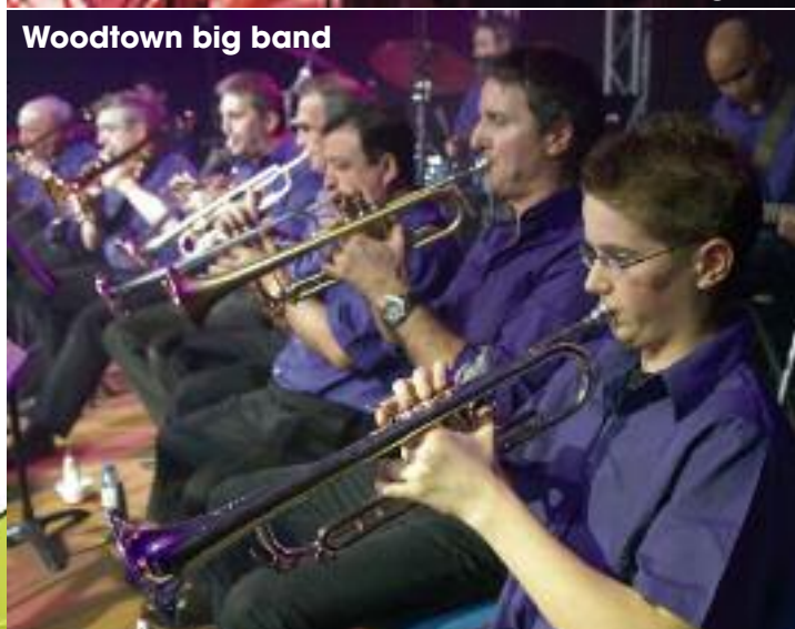
Woodtown big band