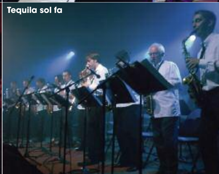
Tequila sol fa