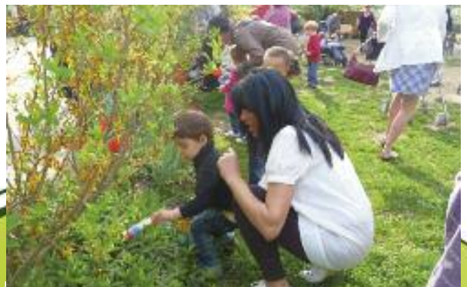
Douceur estivale pour l'édition 2011 de la chasse aux œufs, organisée pour les enfants des trois structures de la ville. Même les adultes s'en donnent à cœur joie !