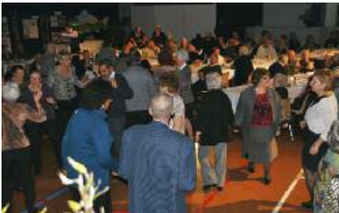
Fin janvier, à l'Escale, le repas du Maire aux anciens a été très apprécié par près de 300 convives : ambiance chaleureuse, repas de qualité, bonne musique...