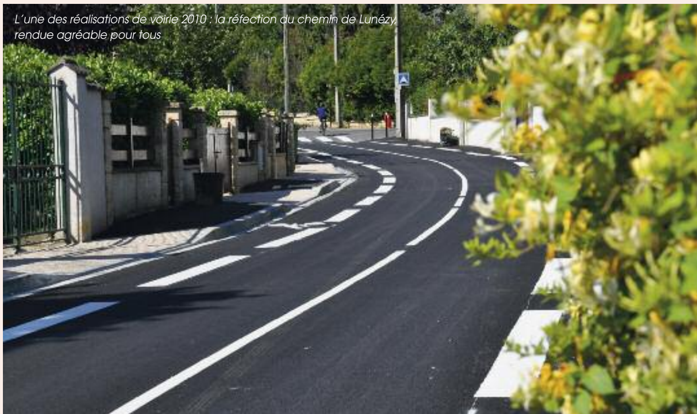
L'une des réalisations de voirie 2010 : la réfection du chemin de Lunézy, rendue agréable pour tous

Chaque année, le vote du budget est une étape importante de la vie de la commune. Il est l'occasion de contrôler le budget de l'année passée et de préciser les choix pour l'année en cours.