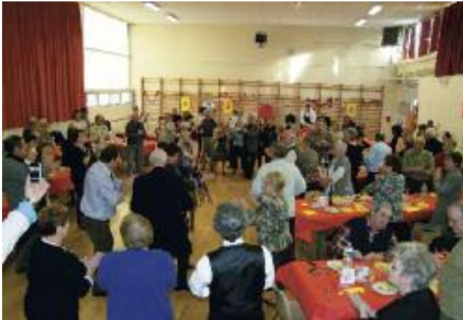
Le repas de fin d'année réunit une centaine d'adhérents, autour de la Russie.