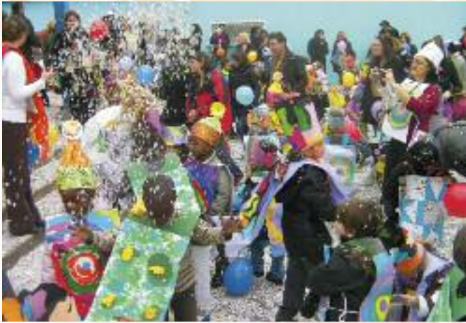
Les enfants de la maternelle Marie Curie se retrouvent dans la cour avec parents et enseignants.