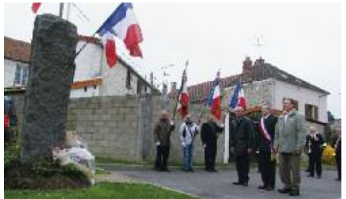
Les participants à la cérémonie observent un moment de recueillement face à la stèle du souvenir du 19 Mars 1962.