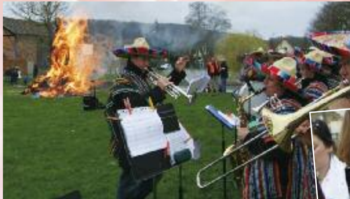
On a brûlé Bineau, ce 12 mars dernier, même sous la pluie !