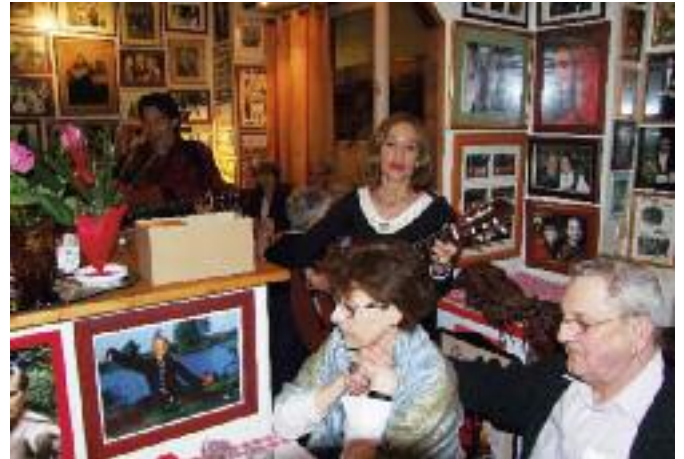
Autre lieu, autre ambiance, même pays : un orchestre russe anime un autre rendez-vous du Syndicat d'Initiative au restaurant.