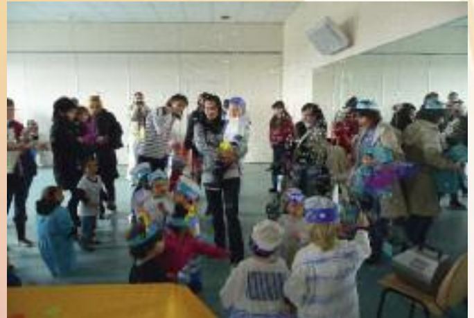
Vendredi 11 mars, tous déguisés, les tout-petits de la ville défilent de la place du Général de Gaulle à l'Escale.