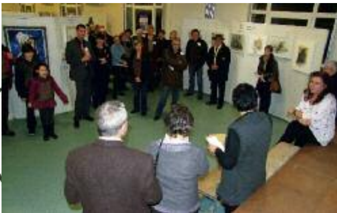
22 artistes, dont 9 de La Ville du Bois, participent au salon qui leur est consacré du 4 au 6 février. Peintures et sculptures sont exposées lors de l'édition 2011 parrainée par Nathalie Dugué, peintre de l'association urbisylvaine "Regard".